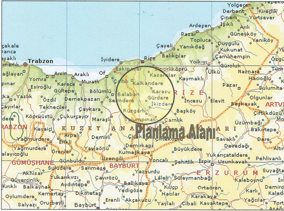
Planlama Alanının Ülke İçindeki Yeri

Rize ilinde büyük bir akarsu olmamasına rağmen, doğudan batıya doğru irili ufaklı birçok akarsu mevcuttur. Bu akarsuların başlıcaları Fındıklı, Fırtına, Hemşin, Çayeli, Taşlıdere ve İyidere'dir. Bu akarsular, sürekli akışı olan ve debisi yüksek akarsulardır. Akarsuların geçtiği bölgeler genellikle eğimli olduğu için mecrada kısa mesafelerde değişen kot farkı nedeniyle hızlı bir akış vardır. Bu nedenle bahse konu akarsulardan elektrik enerjisi üretiminde faydalanmak olasıdır. Bu bağlamda DSİ tarafından 1985 yılında yöre için bir plan raporu hazırlanmış ve bu raporda İyidere'nin yaklaşık 222m. ile 456m. kotları arasında kalan hidroelektrik potansiyelinin değerlendirilmesi yapılmıştır.