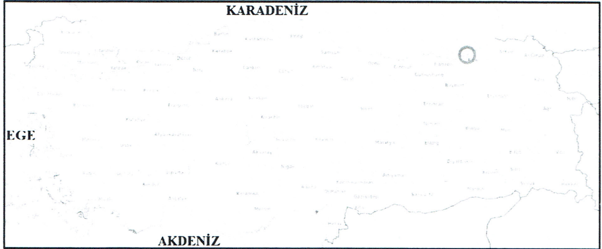
Şekil 1. Planlama Alanının Ülkesindeki Yeri

İmar planına konu olan alan, Rize İli, Rize-İkizdere il yolu, Çağrankaya ve Çarşı Mahallesi sınırları içerisinde yer almaktadır. Mevcut imar planlarının G45-A-22-A-1-D, G45-A-22-A-4-A, G45-A-22-A-4-B, G45-A-22-A-4-C, G45-A-22-D-1-B ve G45-A-22-D-2-A paftalarında 4516400-4518500 dikey ve 377800-378700 yatay koordinatları arasında yer almaktadır. Planlama alanı, Rize-İkizdere karayolunun şehir geçişini kapsamaktadır.